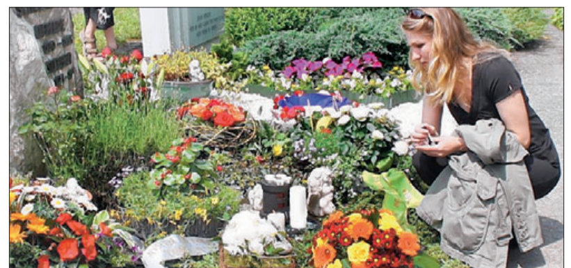
Freundin Maria (*) nimmt bei der Trauerfeier 2008 in Hessental Abschied von Denis Schütze. Die Urne wurde ins Grab der Großmutter gelegt. Einen eigenen Grabstein hat Denis Schütze noch nicht.

* Namen wurden von der Redaktion geändert.